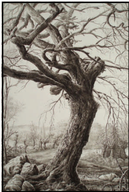
F. Houtin « Samothrace N°4 » Lavis, encre de chine 2011 58x38,5 cm

C'est J.J.J. RIGAL qui a encouragé F. Houtin en lui faisant illustrer son premier livre de bibliophilie pour la société des Impénitents « La fille de Rappaccini » nouvelle de Nathaniel Hawthorne, en 1980.