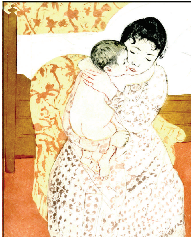
Gravure de Mary Cassatt : la maternité Édition Bibliothèque nationale et Tchou, 1991 Collection particulière

Non seulement femme mais aussi étrangère ! Chez