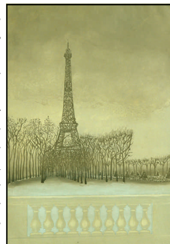
J.J.J. RIGAL « Décembre au champ de Mars »