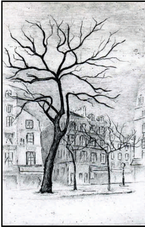
Edmond RIGAL « place Contrescarpe »